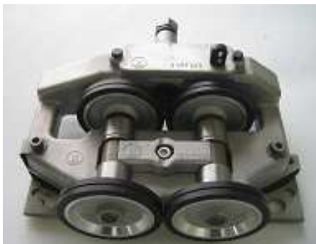
H.2500.01.1 Rotorlager kpl. C