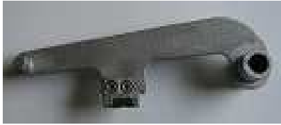
H.2500.11.1 Bremshebel C