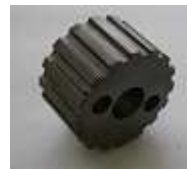
H.0300.80.1 Zahnriemenrad Z 16 - Z64