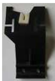
H.1300.46.4 Fadenführer unten,3