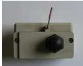
H.3300.64.1 Fadenwächter kpl.