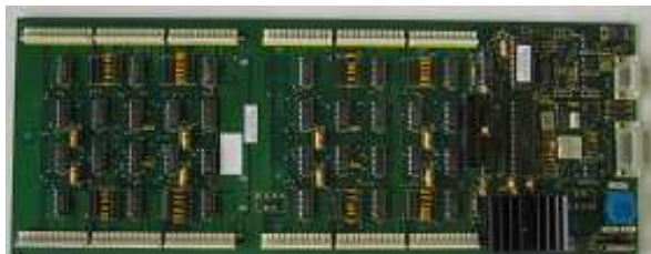
H.4100.10.1 Sektions Elektronik Platine RU14