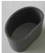
H.1300.13.1 Gummiring für Friktionswalze