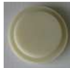
H.2700.38.1 Spulenteller Zyl. D54