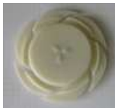
H.2700.31.1 Fadenreserveteller zyl. D54