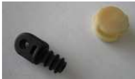
H.2500.33.2 Verschluss - Stopfen