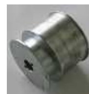
H.2501.37.1 Laufrolle kpl. C H.2502.37.5 Laufrolle kpl. C1