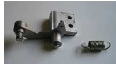
H.1300.80.2 Hebel f. Oberwalze kpl.