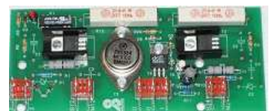
H.4500.22.1 N7 DUO - Thyristor