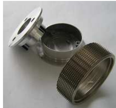
H.2000.28.5 Auflösewalze SOLID RING OS21-6 kpl. H.2000.28.6 SOLID RING OS21-6