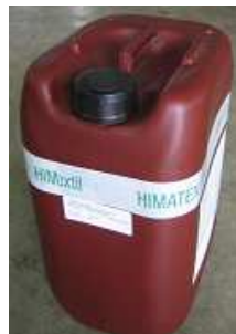
H.2500.60.1 Öl f. Rotorlager