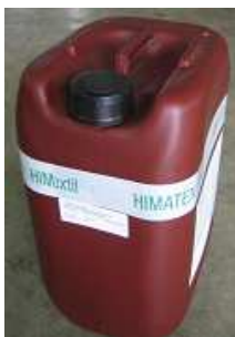
H.0201.67.1 Synt. Öl f. Getriebe