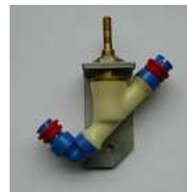
H.3300.38.5 Ventil kpl. P