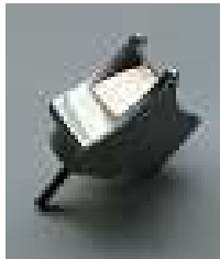
H.2000.05.1 Speisemulde fein H.2000.05.2 Speisemulde grob