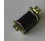
H.3300.94.1 Magnet f. Fadenwächter