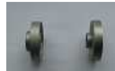
H.2300.17.1 Treibscheibe Stahl