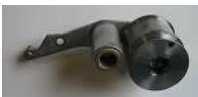
H.2501.11.1 Rollenhebel C H.2502.11.5 Rollenhebel C1