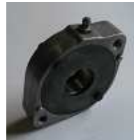
H.2300.18.1 Lager kpl.