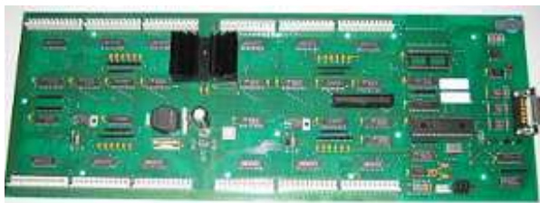
H.4100.20.1 Sektions Elektronik Platine RU14-A