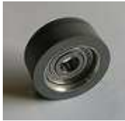
H.1300.89.2 Oberwalze kpl. mit Lager