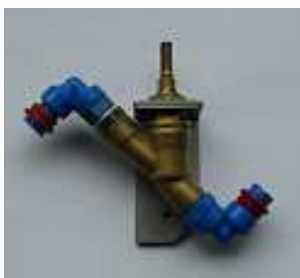
H.3300.38.1 Ventil kpl. M