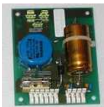
H.4500.08.1 Power Filter