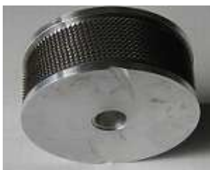
H.2000.28.1 Auflösewalze OB20