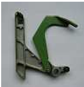
H.3300.33.1 Hebel f. Rotorreinigung