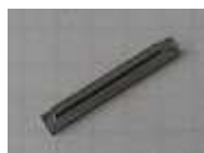
H.2000.28.8 Clip f. Auflösewalzengehäuse