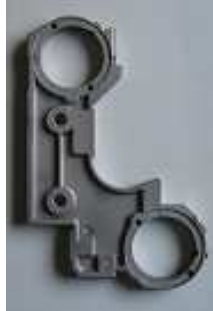
H.1300.05.1 Lager f. Friktions- u. Abzugswelle