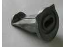
H.2000.48.4 Einsatz f. Auflösewalzengehäuse