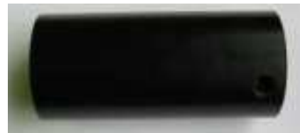
H.1300.12.2 Friktionswalze solid