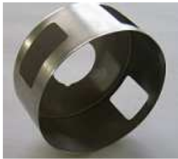
H.2300.02.4 Topf f. Auflösewalzengehäuse 16 mm