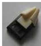
H.1300.24.4 Fadenführer 1,3