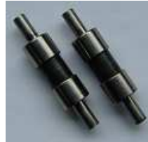
H.2501.29.1 Twin disc - Lager