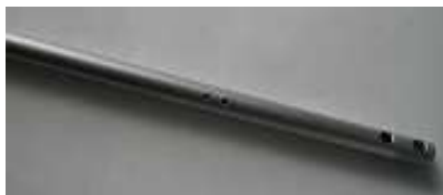
H.1300.22.4 Fadenführerstange oben