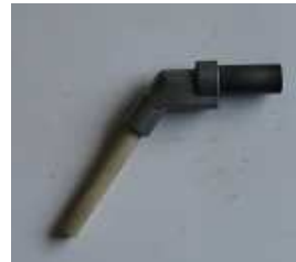
H.3300.73.1 Fadenführungsrohr soft twist