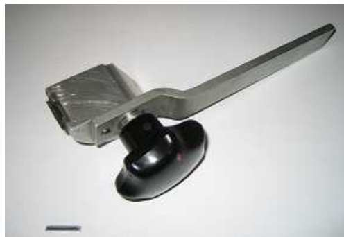
H.2000.28.9 Werkzeug f. Auflösewalzengehäuseclip