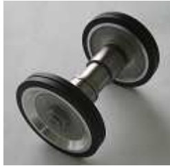
H.2500.28.1 Stützscheibe kpl. mit Lager