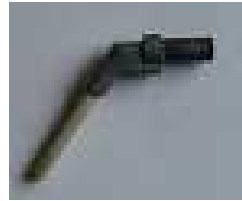
H.3300.73.1 Fadenführungsrohr soft twist