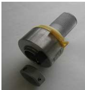
H.210.06.8 Kuplung f. Einzelspeisung