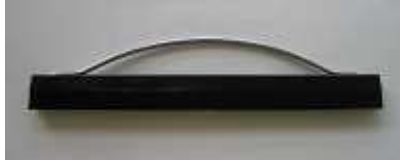
H.1300.36.1 Klemmleiste mit Bügel