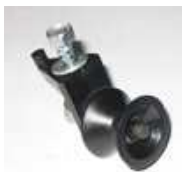
H.1300.42.4 Rolllager + Rolle