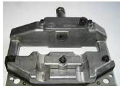
H.2500.02.1 Rotorlagergehäuse C