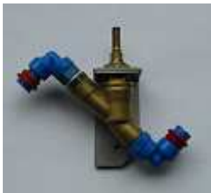
H.3300.38.1 Ventil kpl. M