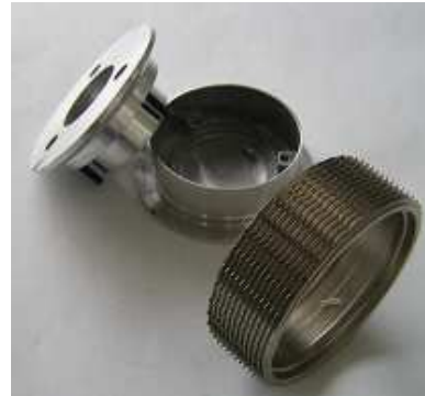
H.2000.28.5 Auflösewalze SOLID RING OS21-6 kpl.