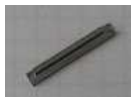
H.2000.28.8 Clip f. Auflösewalzengehäuse