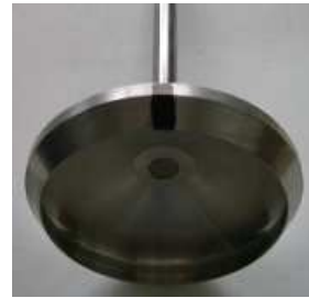
D80 mm R3