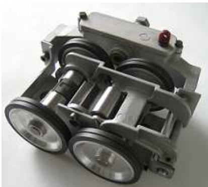
H.2500.01.5 Rotorlager kpl.