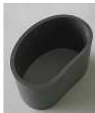
H.1300.13.1 Gummiring f. Friktionswalze