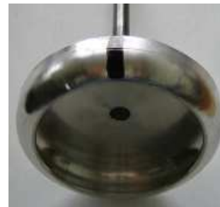
D92 mm R8

H.2600.16.35.5 Rotor D35 mm beschich. / B-Schaft