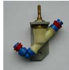
H.3300.38.5 Ventil kpl. P