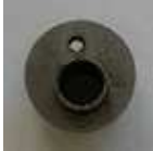
H.2500.06.1 Bremsbuchse vorne