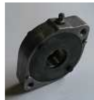
H.2300.18.1 Lager kpl.