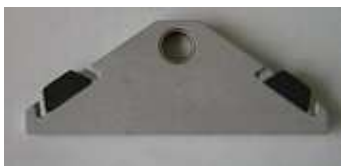
H.2500.21.1 Bremsflasche kpl.