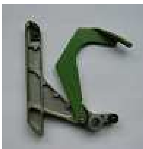
H.3300.33.5 Hebel f. Rotorreinigung kpl.