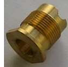
H.2500.05.1 Bremsbuchse hinten