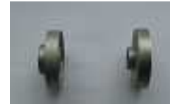
H.2300.17.1 Treibscheibe Stahl