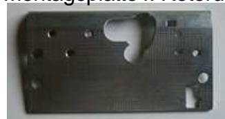
H.3300.03.5 Montageplatte f. Rotordeckel