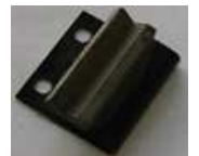
H.2500.18.1 Bremsfeder kpl.