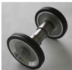
H.2500.28.5 Stützscheiben m. Lager kpl.