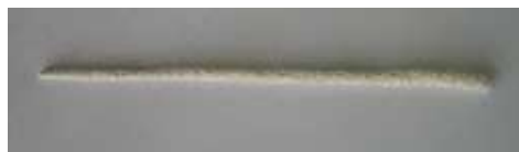
H.3300.75.1 Reiniger f. Abzugsrohr und Düse