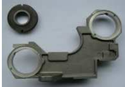
H.1300.05.4 Lager f. Friktions u. Abzugswelle