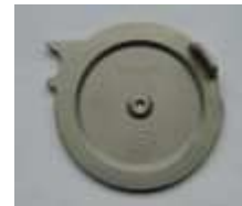
H.2000.03.6 Deckel f. Auflösewalzengehäuse