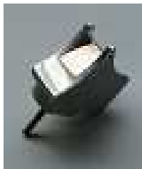
H.2000.05.1 Speisemulde fein