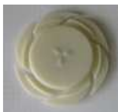
H.2700.31.1 Fadenreserveteller grob. D54