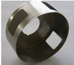
H.2300.02.7 Topf für Auflösewalzengehäuse 16 mm