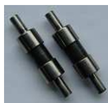
H.2500.29.5 Twin Disc - Lager