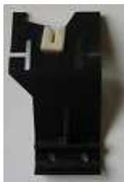
H.1300.46.4 Fadenführer unten 1,3