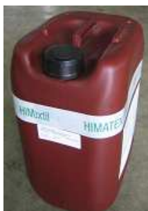
H.0201.67.1 Synt. Öl für Getriebe