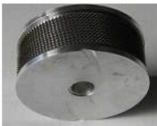
H.2000.28.1 Auflösewalze OB20