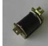
H.3300.94.5 Magnet f. Fadenwächter