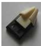
H.1300.24.4 Fadenführer 1,3