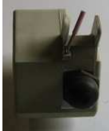
H.2200.17.1 Fadenwächter kpl.