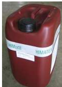
H.2500.60.1 Spezial-Getriebeöl f. Rotorlager