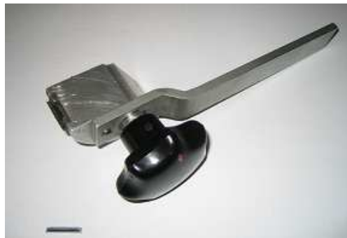
H.2000.28.9 Werkzeug f. Auflösewalzengehäuseclip