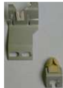
H.1300.24.8 Fadenführer 1,3