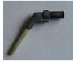
H.3300.73.1 Fadenführungsrohr soft twist