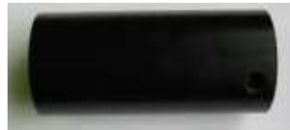
H.1300.12.2 Friktionswalze solid