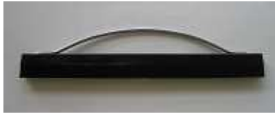
H.1300.36.4 Klemmleiste mit Bügel