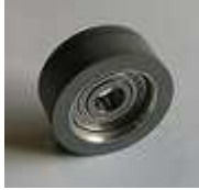
H.1300.89.2 Oberwalze kpl. mit Lager