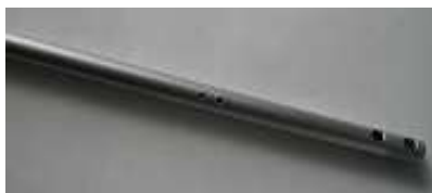
H.1300.22.6 Fadenführerstange oben RU11