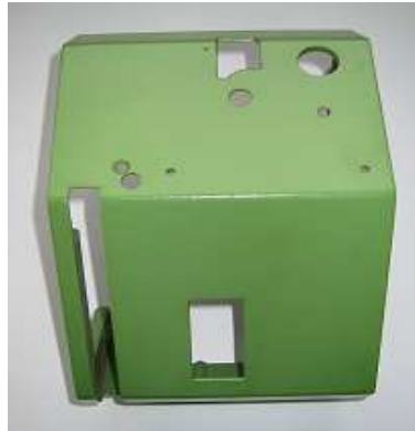
H.3300.02.5 Verdeck RU11